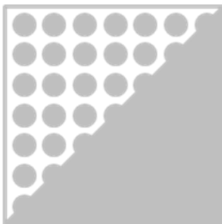
ORAFLEX® 11755EXP01 средний